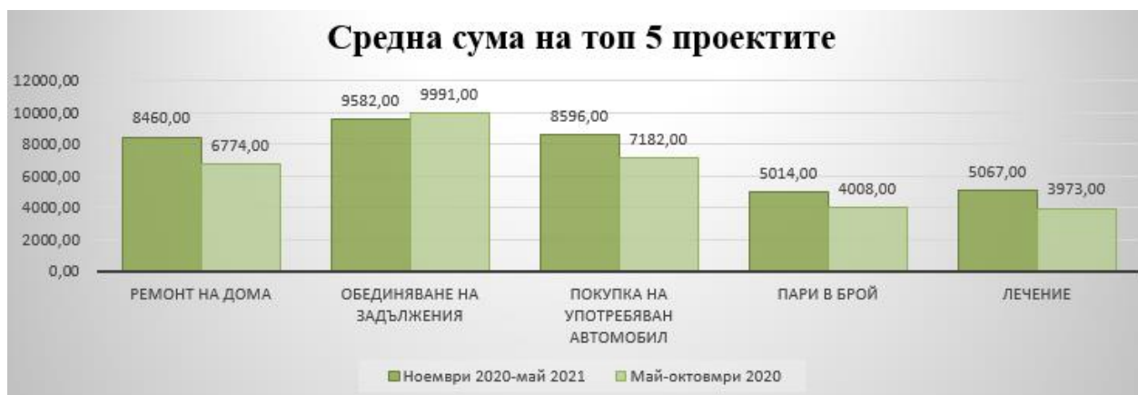
Таблица 2: Средна сума на молбите за топ 5 проектите

Още по-значителен ръст - с 18,6% е регистриран при средният размер на заявките за топ 5 цели, които формират близо 90% от всички проекти. Например, размерът на заявките за обновяване на дома нарасна от 6 771 лв. до 8 460 лв., За покупка на употребявани автомобили - от 7 182 лв. до 8 596 лв., а за медицинско лечение - от 3 973 лв. до 5 067 лв. Лек спад от 4% е регистриран при средния размер на кредитите за обединяване на задължения - от 9 991 лв. през май-октомври 2020 г. до 9 582 лв. през ноември 2020 г.-май 2021 г.